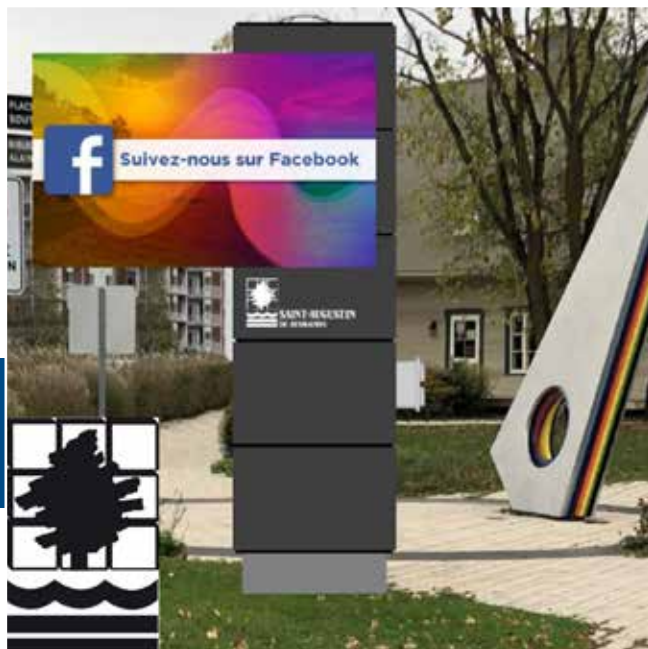
- INTERSECTION DES ROUTES 138 ET FOSSAMBAULT -