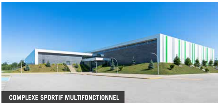
COMPLEXE SPORTIF MULTIFONCTIONNEL