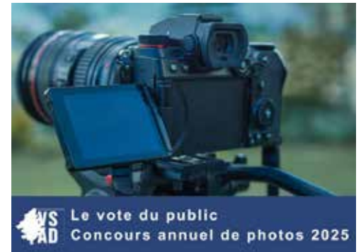
VSAD Le vote du public Concours annuel de photos 2025

Nous remercions ceux et celles qui ont voté pour leurs photos favorites.