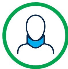
Protège cou recommandé