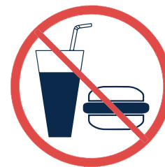
Boire et manger