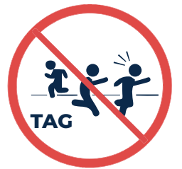
Jeux de tag