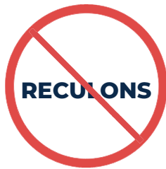
Patinage à reculons