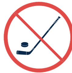
Bâton et rondelle