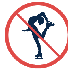
Pirouettes et figures