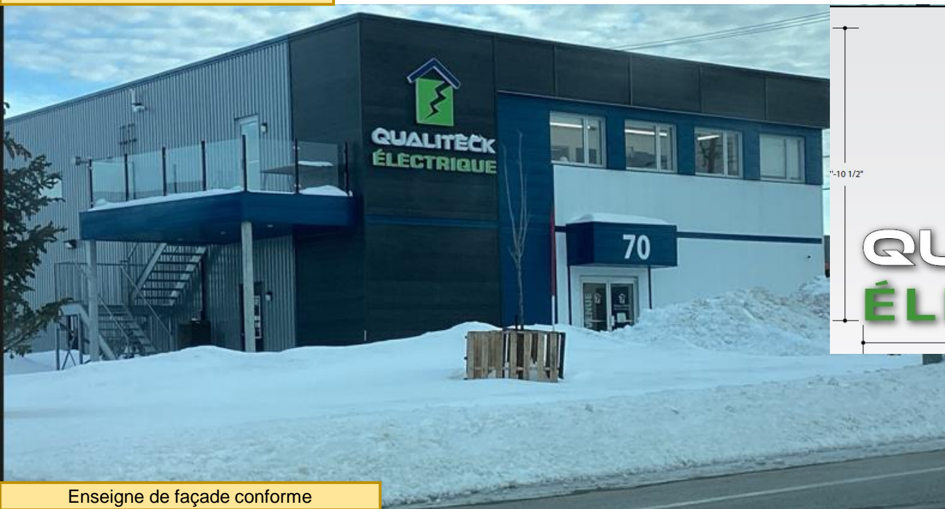
Enseigne de façade conforme