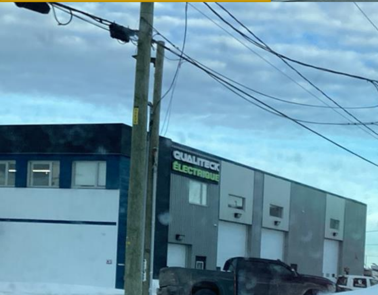
Enseigne latérale visée par la demande de dérogation mineure