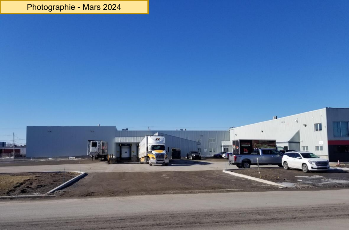
Photographie - Mars 2024