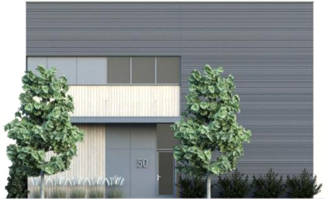
ELEVATION AVANT - COULEUR

À titre d'information - projet soumis précédemment au CCU et au Conseil – Résolution 2021-439 PIIA