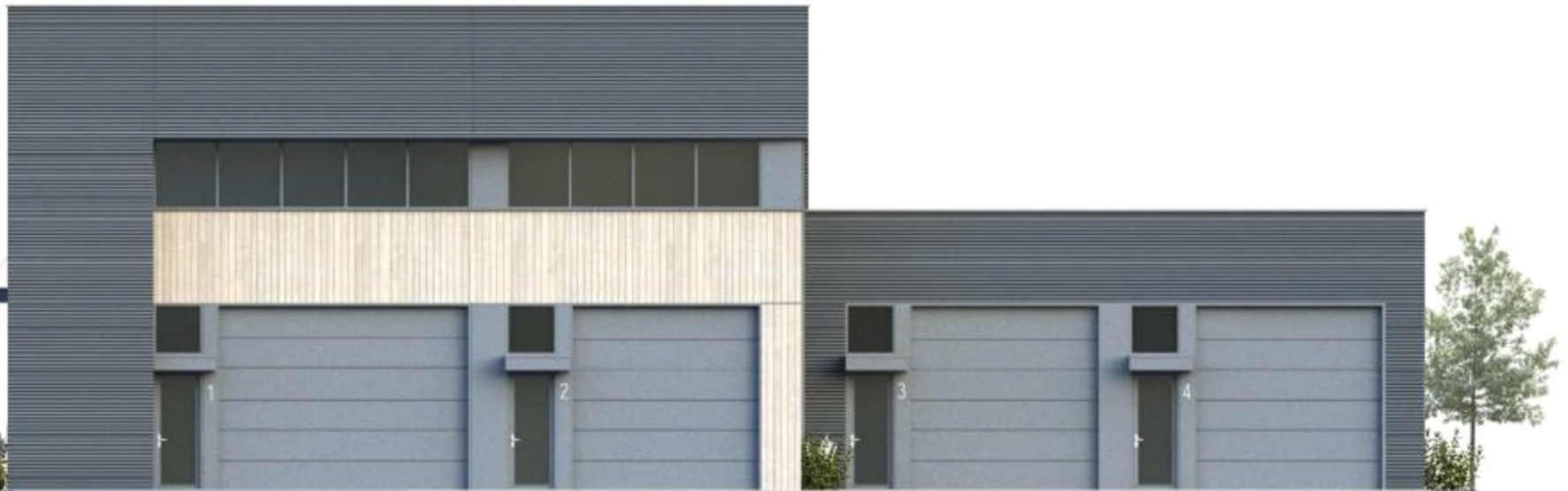
ELEVATION LATÉRALE DROITE - COULEUR