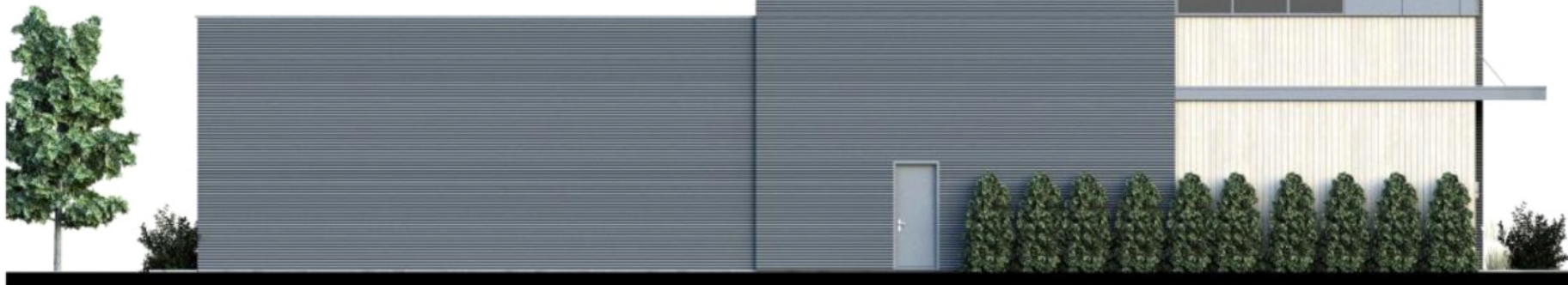
ELEVATION GAUCHE - COULEUR