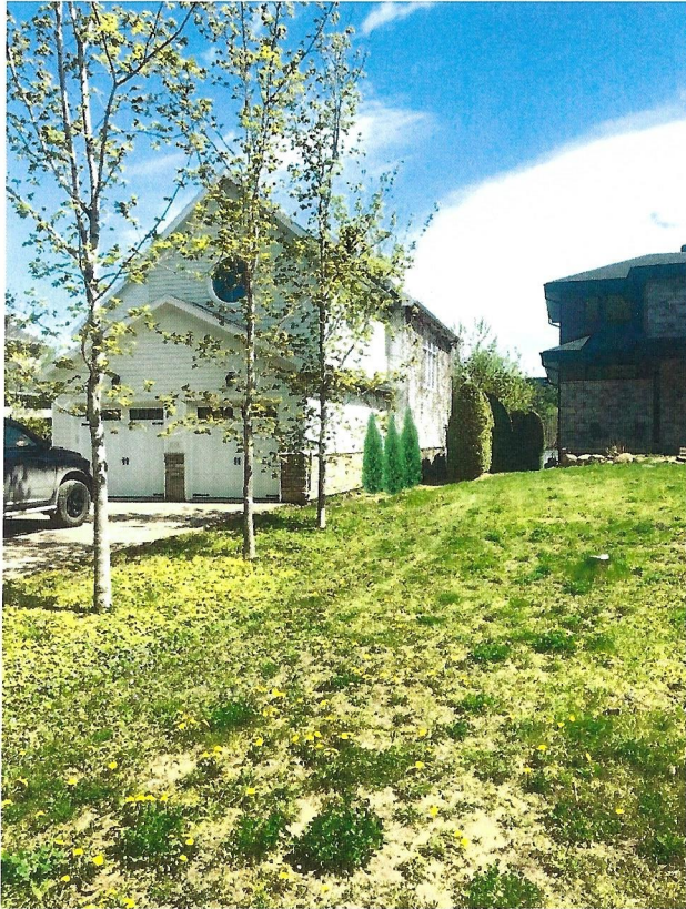
Visuel projeté de l'aspect final de la haie protectrice