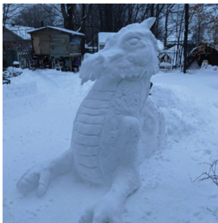
Une photo de Louis Rathier