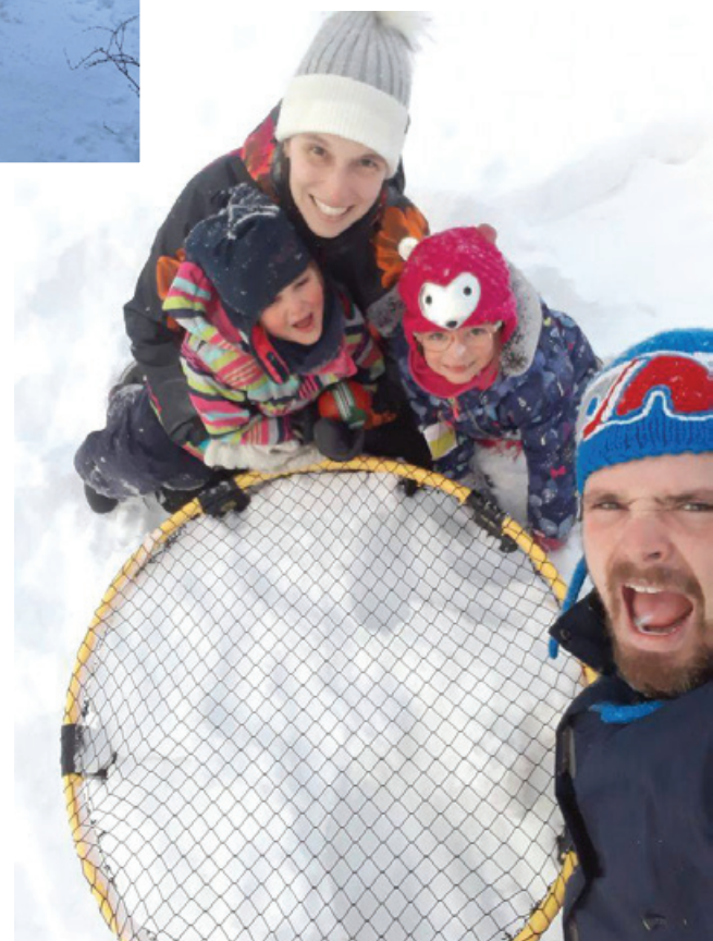
Spikeball sur neige